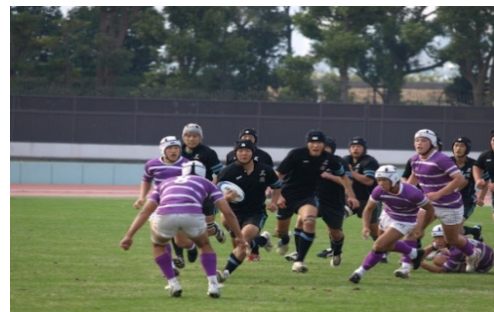
花園予選ベスト4 東京高校戦（2009年）